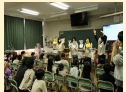
「大森浜教育の日」の様子