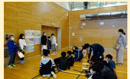
港小学校 参観の様子