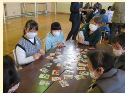
防災カルタでの交流風景