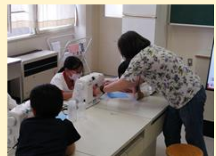
ミシン学習サポートの様子