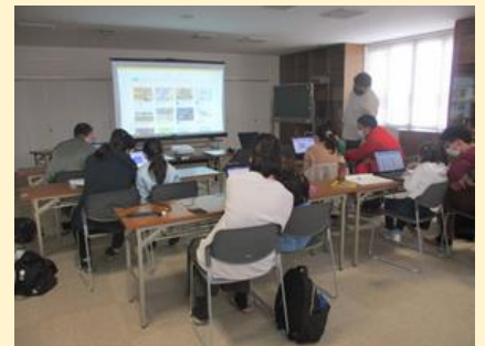
プログラミング研修の様子