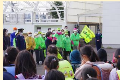
函館市町会の防犯パトロールの集会にて