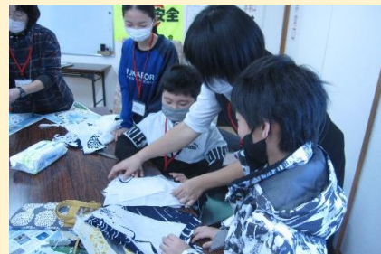
ウエス作成の様子