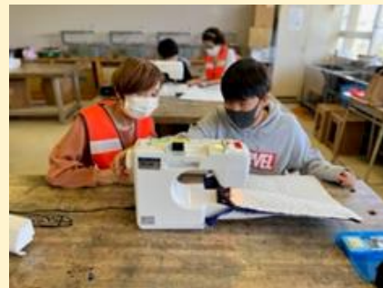
ミシン実習の様子