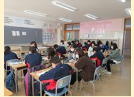
学習サポート会の様子