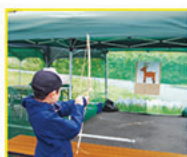
弓矢での的当て体験