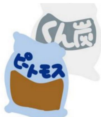
ピートモス・もみ殻くん炭