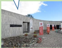
縄文文化交流センター