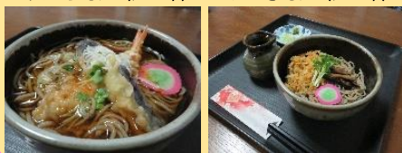
天ぷらそば（温or冷） たぬきそば（温or冷）