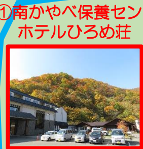
①南かやべ保養センター ホテルひろめ荘