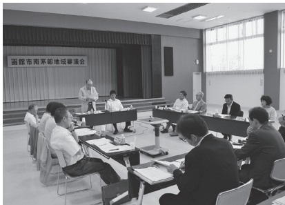
▲ 南茅部地域審議会の様子

第1回地域審議会を、7月24日～30日に各支所で開催し、事務局から前回会議の意見等の集約結果と取組状況、29年度の事業実績などについて説明があったほか、地域振興全般