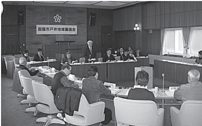
▲戸井地域審議会の様子