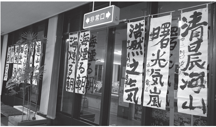
▲昨年度の榎法華地区での展示の様子