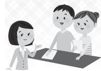
表1のとおり受付します。