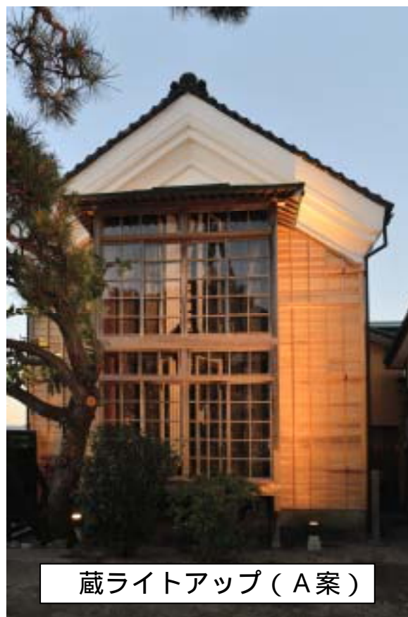
蔵ライトアップ（A 案）