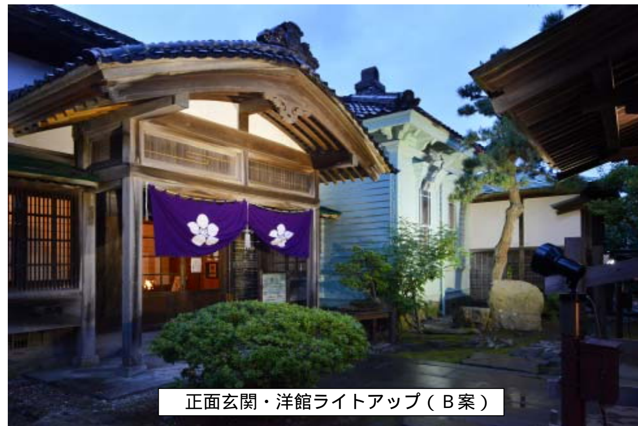
正面玄関・洋館ライトアップ（B 案）