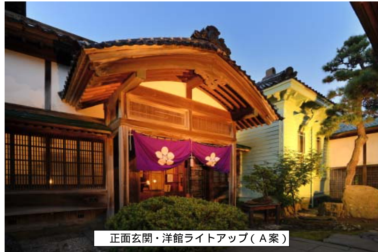
正面玄関・洋館ライトアップ（A 案）